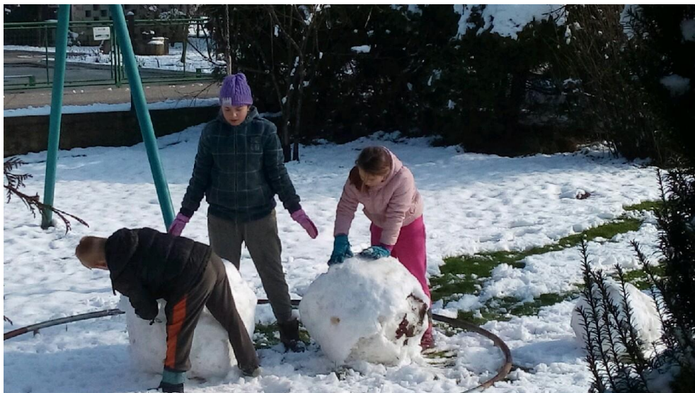
SANKANJE IN IZDELAVA SNEŽAKOV V OKOLICI DOMA.